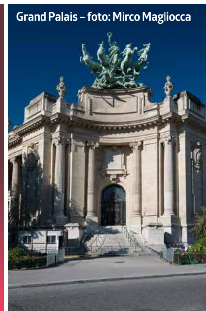
Grand Palais

ver weg en je keert er opvallend 'zen' weer in terug.