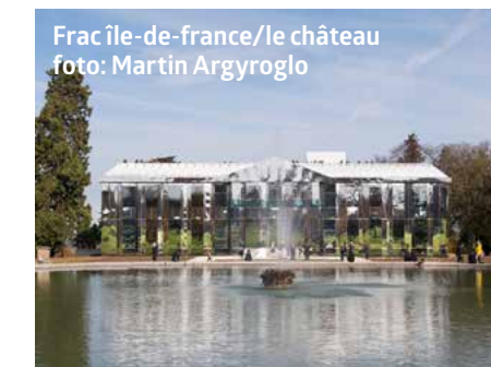
Frac Île-de-France/le château