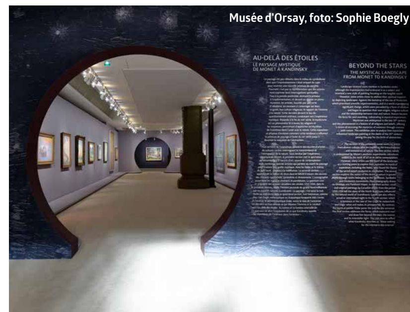
Musée d'Orsay, foto: Sophie Boegly

Het complete feestprogramma: centrepompidou40ans.fr