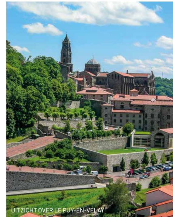
UITZICHT OVER LE PUY-EN-VELAY

nu dat nog doen, betwijfel ik. Meestal is het: hup naar de ochtendmis en dan, niet veel later, gáán. Ze hebben meer haast. Ook opvallend: ze wandelen vooral om spirituele redenen, niet zozeer om religieuze. Ze willen in alle rust kunnen nadenken over zichzelf, over de essentie van het leven. Gedachten over hun relatie met God kunnen de revue passeren,